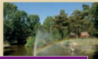
Limburg; onvergetelijk en mooi!