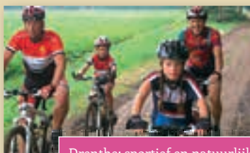
Drenthe; sportief en natuurlijk!