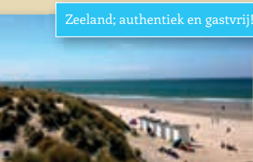
Zeeland; authentiek en gastvrij!