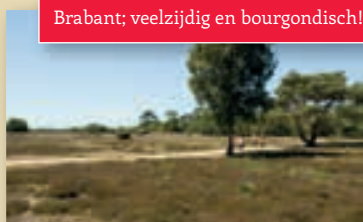
Brabant; veelzijdig en bourgondisch!