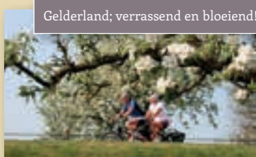
Gelderland; verrassend en bloeiend!