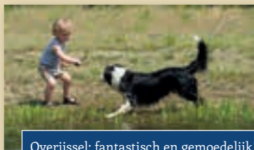
Overijssel; fantastisch en gemoedelijk!